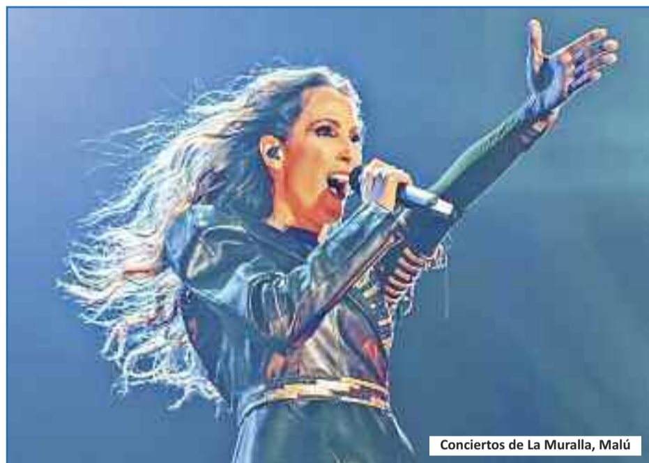
Conciertos de La Muralla, Malú

22:00 h. CONCIERTOS DE LA MURALLA, MALÚ Apertura de puertas 20:30h. Venta de entradas: www.losconciertosdelamuralla.com