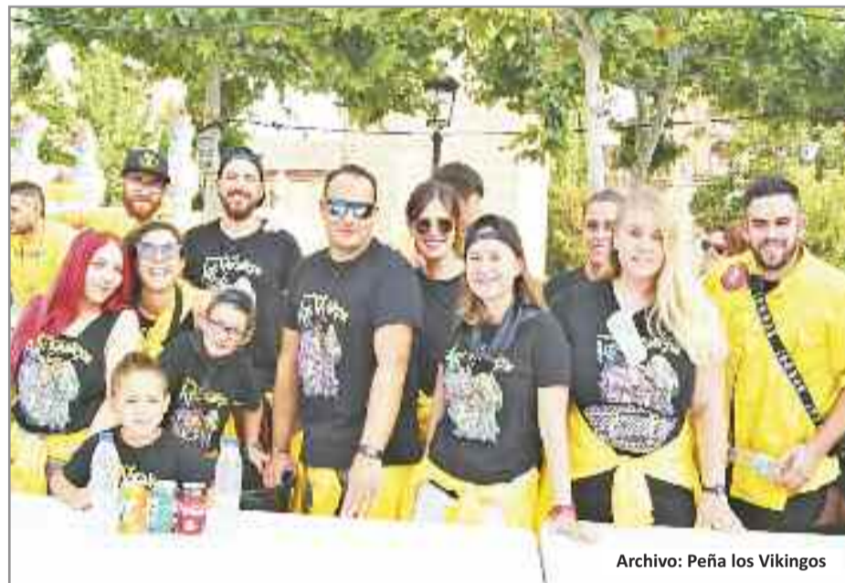
Archivo: Peña los Vikingos

12:00 h. Peña Los Vikingos, CONCURSO DE DIBUJO INFANTIL. Inscripción 30 minutos antes. Participantes desde infantil hasta primeros cursos de la ESO. (Plaza de Cervantes)