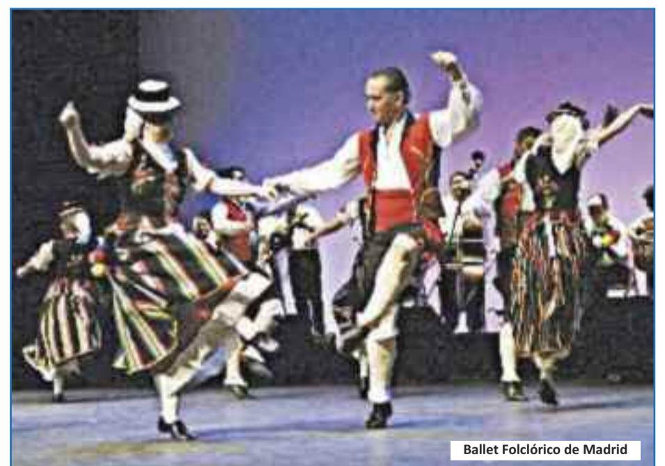
Ballet Folclórico de Madrid

22:00 h. LAS NOCHES DEL PATIO, Ballet Folclórico de Madrid presenta DOS DINASTIAS EN DANZA.