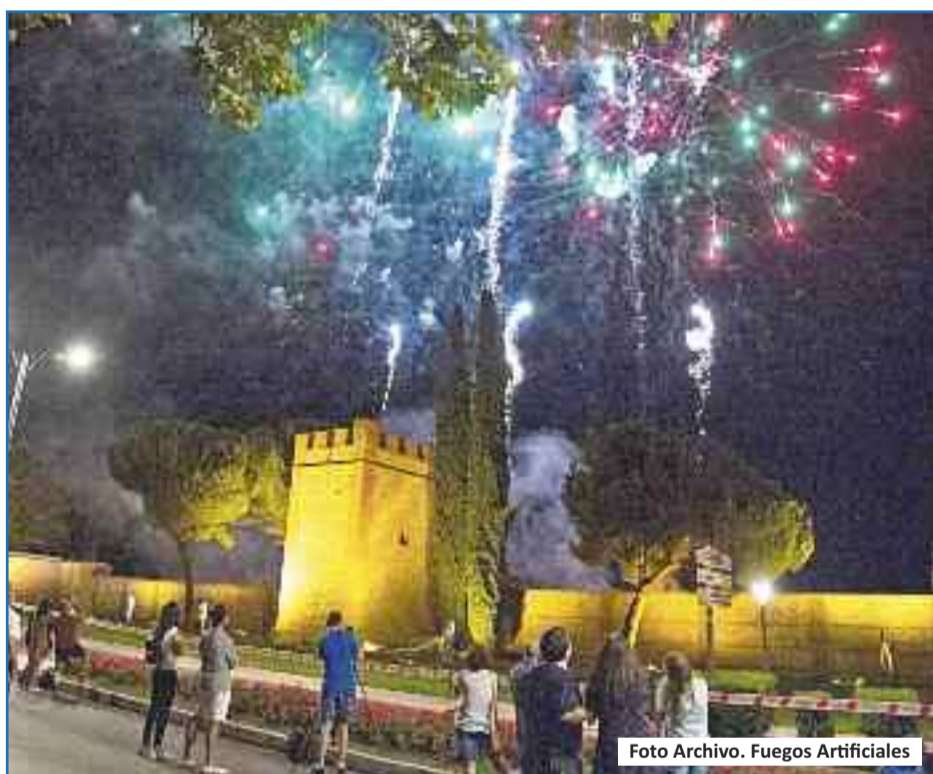
Fuegos Artificiales

23:59 h. CASTILLO DE FUEGOS ARTIFICIALES. FIN DE FIESTAS (Recinto amurallado, Huerta del Obispo)